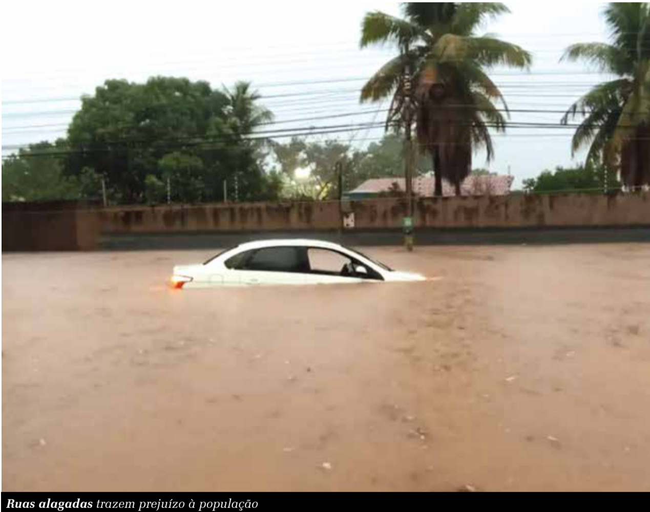
Ruas alagadas trazem prejuízo à população

idéias, que seus líderes se entendam para viabilizar os recursos necessários para as obras que beneficiarão as populações prejudicadas com a ausência da infraestrutura.