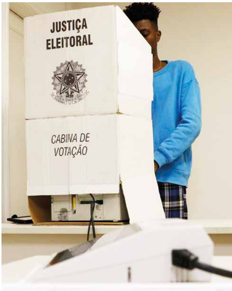
Votação unânime em seções não é indicativo de fraude

A outra seção é criada a cada quatro anos, para que internos da Penitenciária Industrial Regional do Cariri (PIRC), em Juazeiro do Norte, possam exercer o direito ao voto. Na seção 267, Lula obteve 22 votos contra nenhum de Bolsonaro, que havia