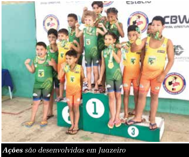
Ações são desenvolvidas em Juazeiro

O Projeto Guerreiros, desenvolvido em Juazeiro do Norte, tem levado oportunidade para crianças e adolescentes. Contemplando 80 alunos, entre 3 e 17 anos, o projeto tem como foco atender filhos de carroceiros, oferecendo atividades como judô e wrestling (luta olímpica). Além disso, há um trabalho de conscientização sobre os maus tratos aos animais.