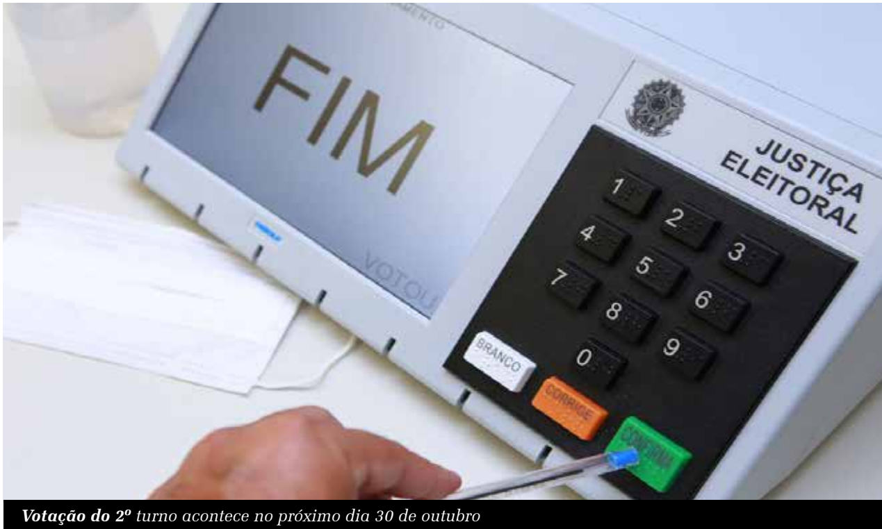
Votação do 2º turno acontece no próximo dia 30 de outubro

Da redação redacao@jornaldocariri.com.br