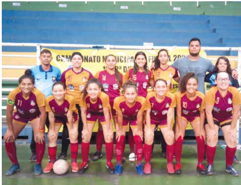
Disputa de futsal feminino possui três fases

Entre os dias 24 de outubro e 11 de novembro, acontece o Campeonato Feminino de Futsal, em Juazeiro do Norte. O evento é realizado pela ONG Construir Ecologicamente (Construeco), com o apoio da Secretaria de Esporte e Juventude de Juazeiro do Norte. São três fases, sendo que a primeira acabou na última sexta-feira (28). A previsão é que a semifinal aconteça no próximo dia 07 e a final no dia 11 de no-