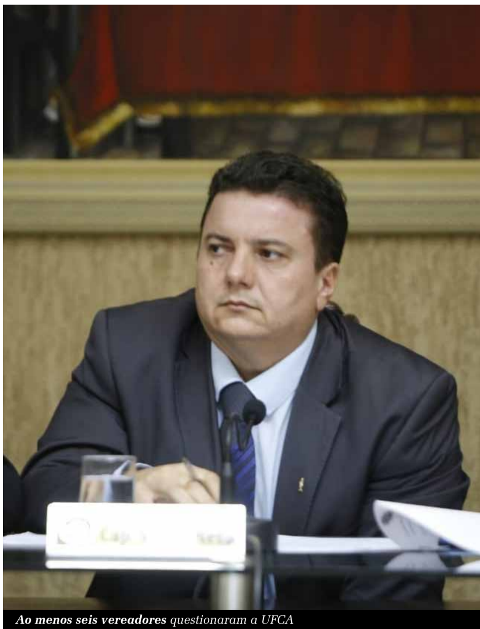
Ao menos seis vereadores questionaram a UFCA