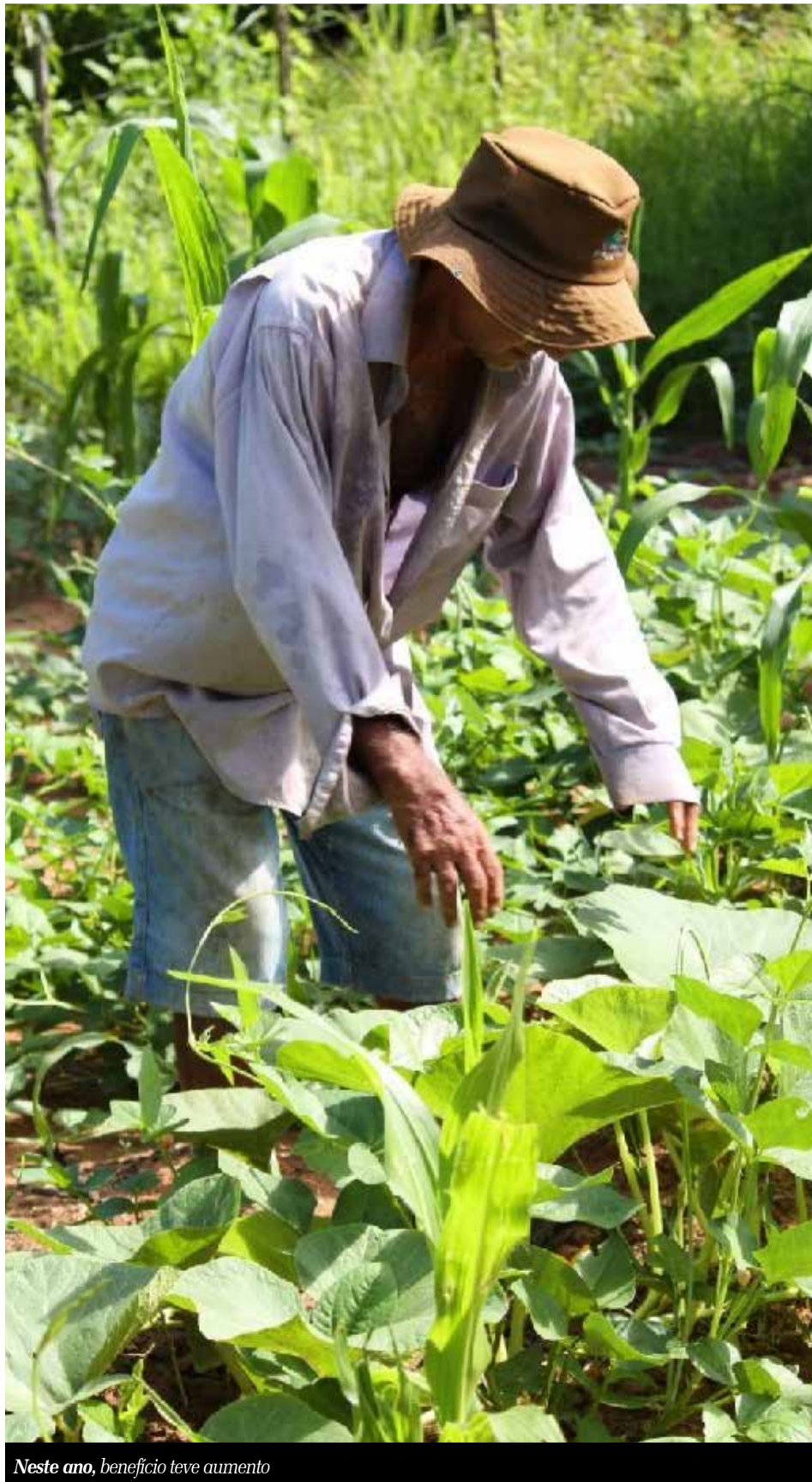
Neste ano, benefício teve aumento