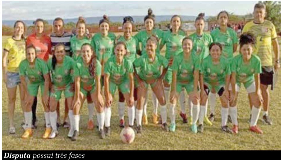
Disputa possui três fases

Geneuza Muniz redacao@jornaldocariri.com.br