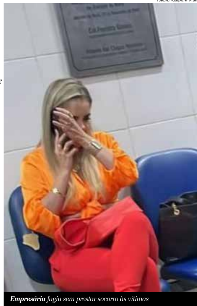
Empresária fugiu sem prestar socorro às vítimas