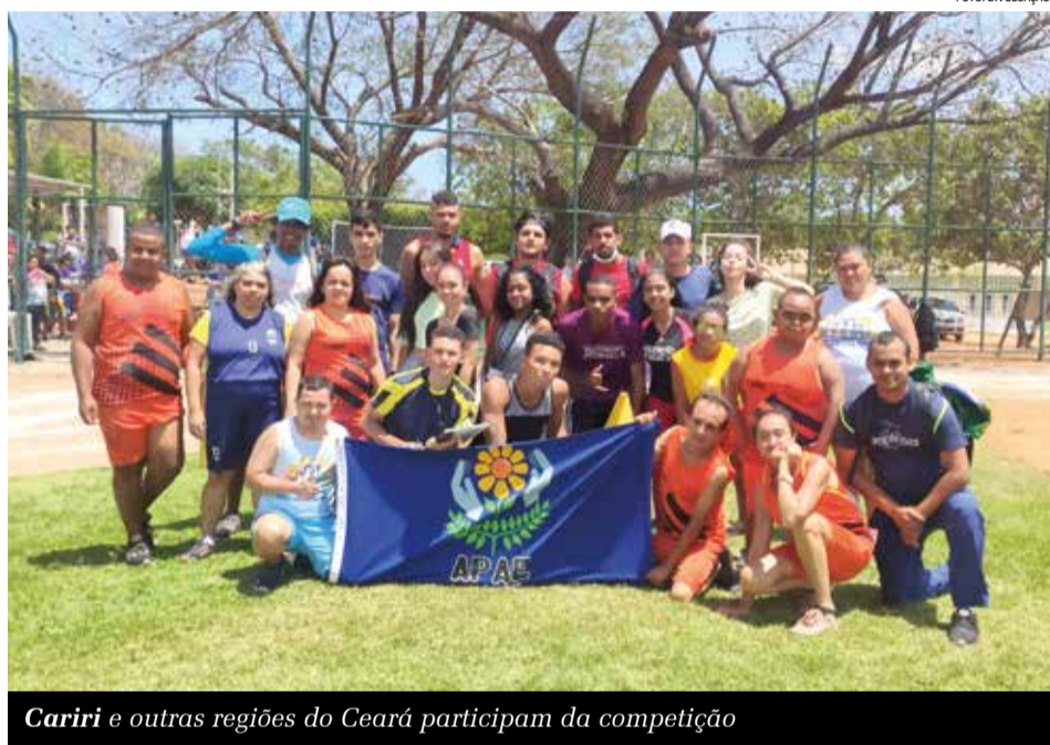
Cariri e outras regiões do Ceará participam da competição

P ela primeira vez, o interior do Ceará está sediando as Olimpíadas Especiais das Associações de Pais e Amigos dos Excepcionais (Apaes). Participam dos jogos, alunos apaeanos das regiões do Cariri, Norte, Centro-Sul e Metropolitana de Fortaleza. As competições reúnem cerca de 180 atletas, nas modalidades de futsal,