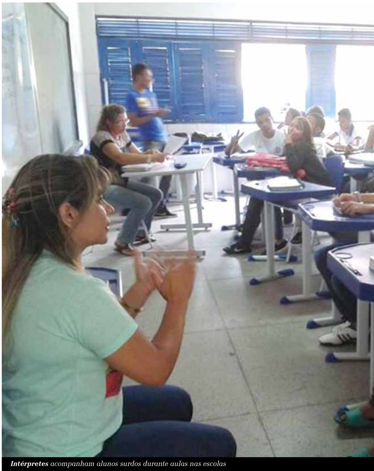
Intérpretes acompanham alunos surdos durante aulas nas escolas

Joaquim Júnior redacao@jornaldocariri.com.br