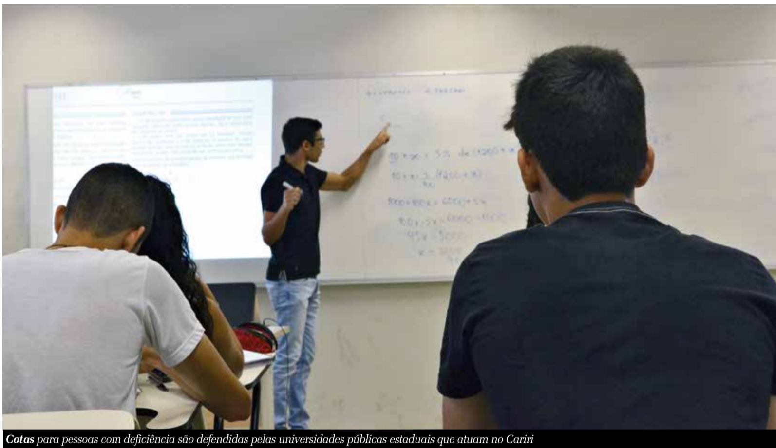
Cotas para pessoas com deficiência são defendidas pelas universidades públicas estaduais que atuam no Cariri

Robson Roque redacao@jornaldocariri.com.br