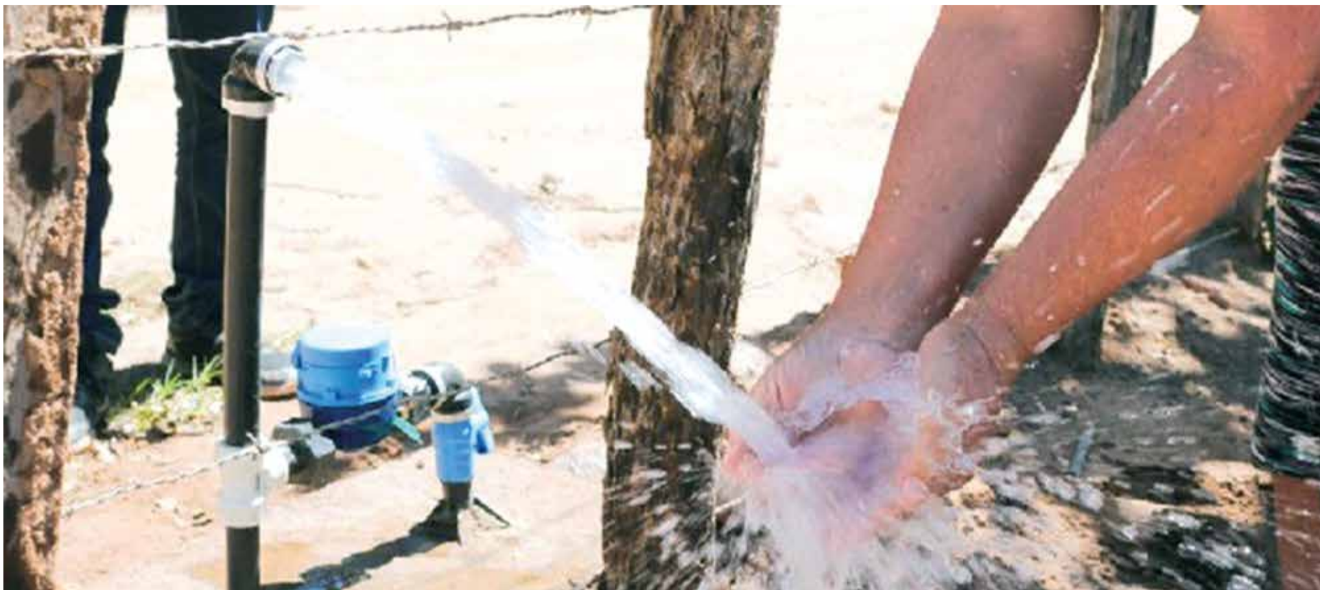
Comunidades rurais serão beneficiadas com novo reservatório