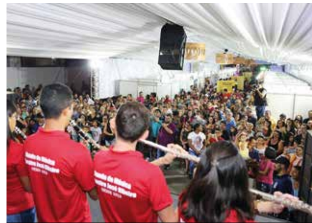
Público celebra padroeiro em festividades