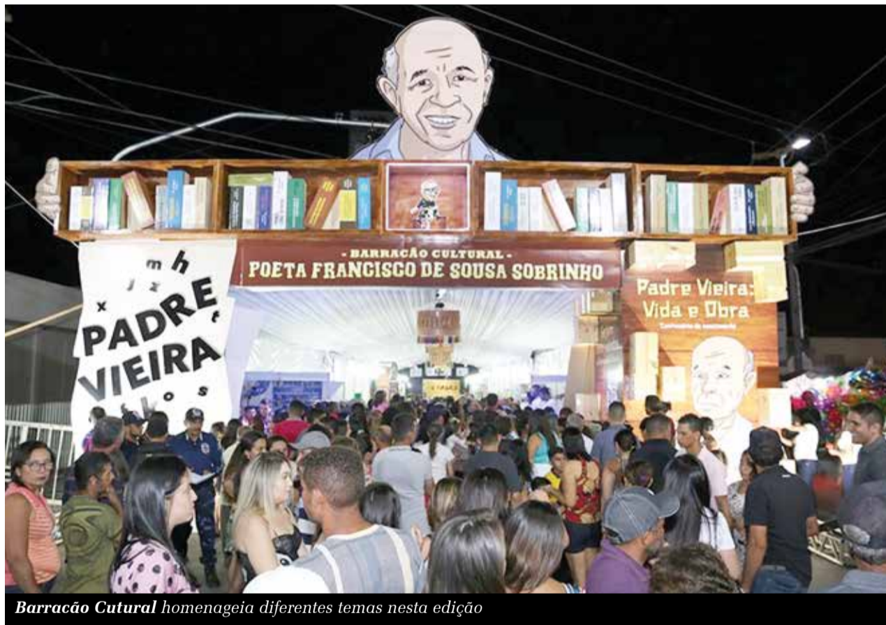
Barracão Cultural homenageia diferentes temas nesta edição

artesãs do que trabalham com barro e fazem peças artesanais, como potes, fogareiros, tachos, travessas etc – uma tradição que tem mais de 100 anos. O Centro de Artesanato