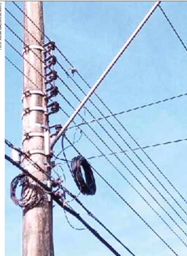
Medida é anunciada após grave acidente fatal

ocorrer nesta terça-feira (16), em que os órgãos de fiscalização da Prefeitura discutirão o assunto. Ainda nesta semana, um Termo de Ajustamento de Conduta deve ser assinado pelas empresas de telefonia, de cabo, de internet e de energia elétrica, que devem atender à convocação da Amaju, para uma reunião na quinta-feira (18).