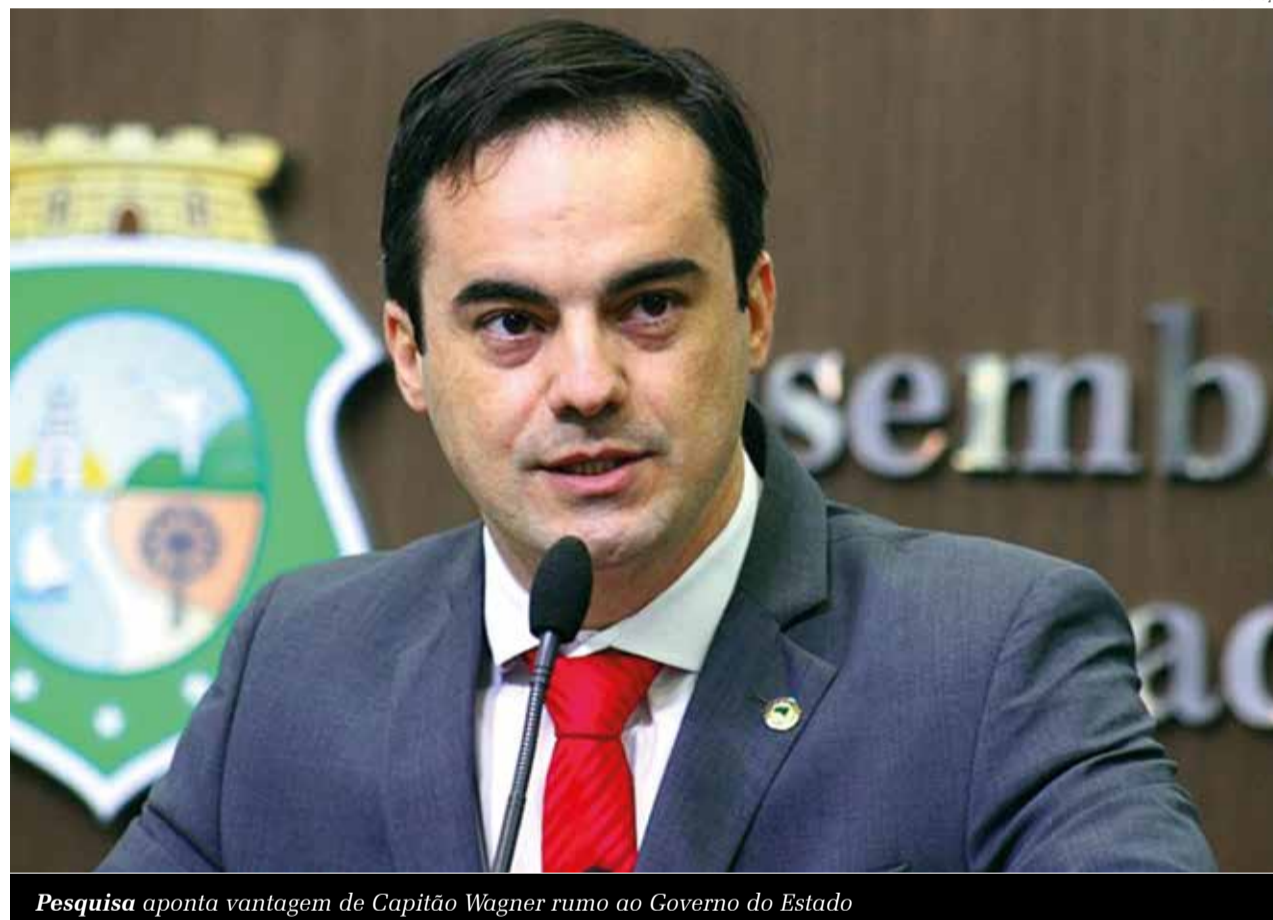
Pesquisa aponta vantagem de Capitão Wagner rumo ao Governo do Estado

do não há uma lista prévia de candidatos, Capitão Wagner foi lembrado por 17,4% dos entrevistados. Neste contexto, Roberto Cláudio e Elmano de Freitas aparecem tecnicamente empatados com 8,7% e 8,2%, respectivamente.