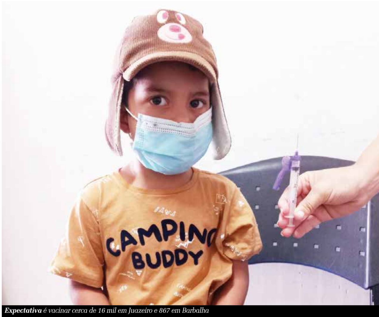
Expectativa é vacinar cerca de 16 mil em Juazeiro e 867 em Barbalha

Saúde está aguardando reposição do estoque da Coronavac, imunizante recomendado pela Agência Nacional de Vigilância Sanitária (Anvisa) para essa faixa etária. A aplicação ocorrerá sem a necessidade de agendamento prévio, na modalidade de livre demanda, em ambos os municípios.