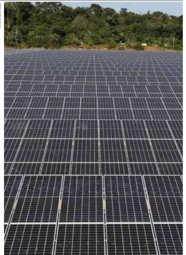
Instalação contribui para redução nas contas

Geneza Muniz redacao@jornaldocariri.com.br