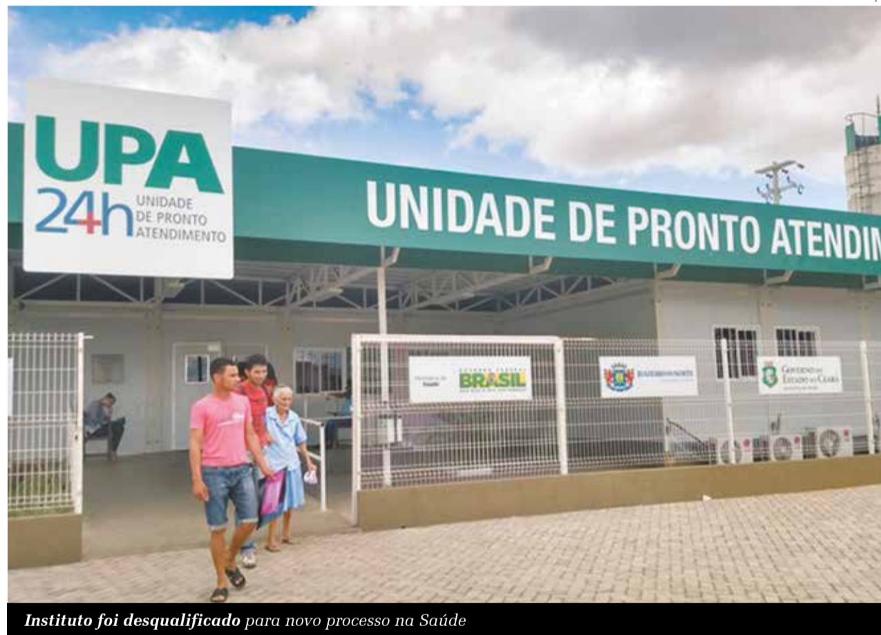
Instituto foi desqualificado para novo processo na Saúde

“Após análise dos documentos entregues pelo Instituto Diva Alves do Brasil – IDAB, frente a todos os requisitos editalícios, a Coquali, através de criteriosa análise, emitiu decisão desfavorável à qualificação até reavaliação dos documentos eventualmente apresentados para sanar o vício apontado”, declara a comissão em publica-