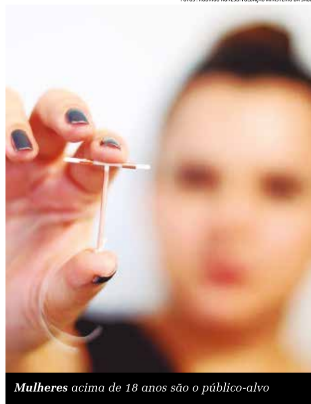
Mulheres acima de 18 anos são o público-alvo

O primeiro atendimento ocorreu no último dia 22 de junho, no Centro de Espe-