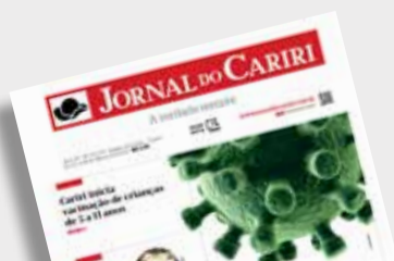
Município recebeu uma tailandesa e receberá uma italiana