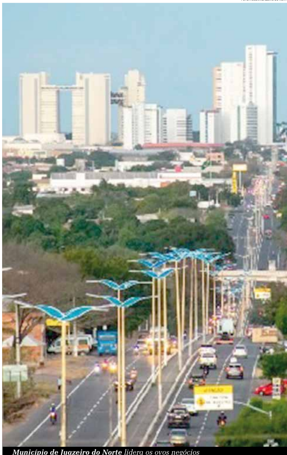
Município de Juazeiro do Norte lidera os ovos negócios