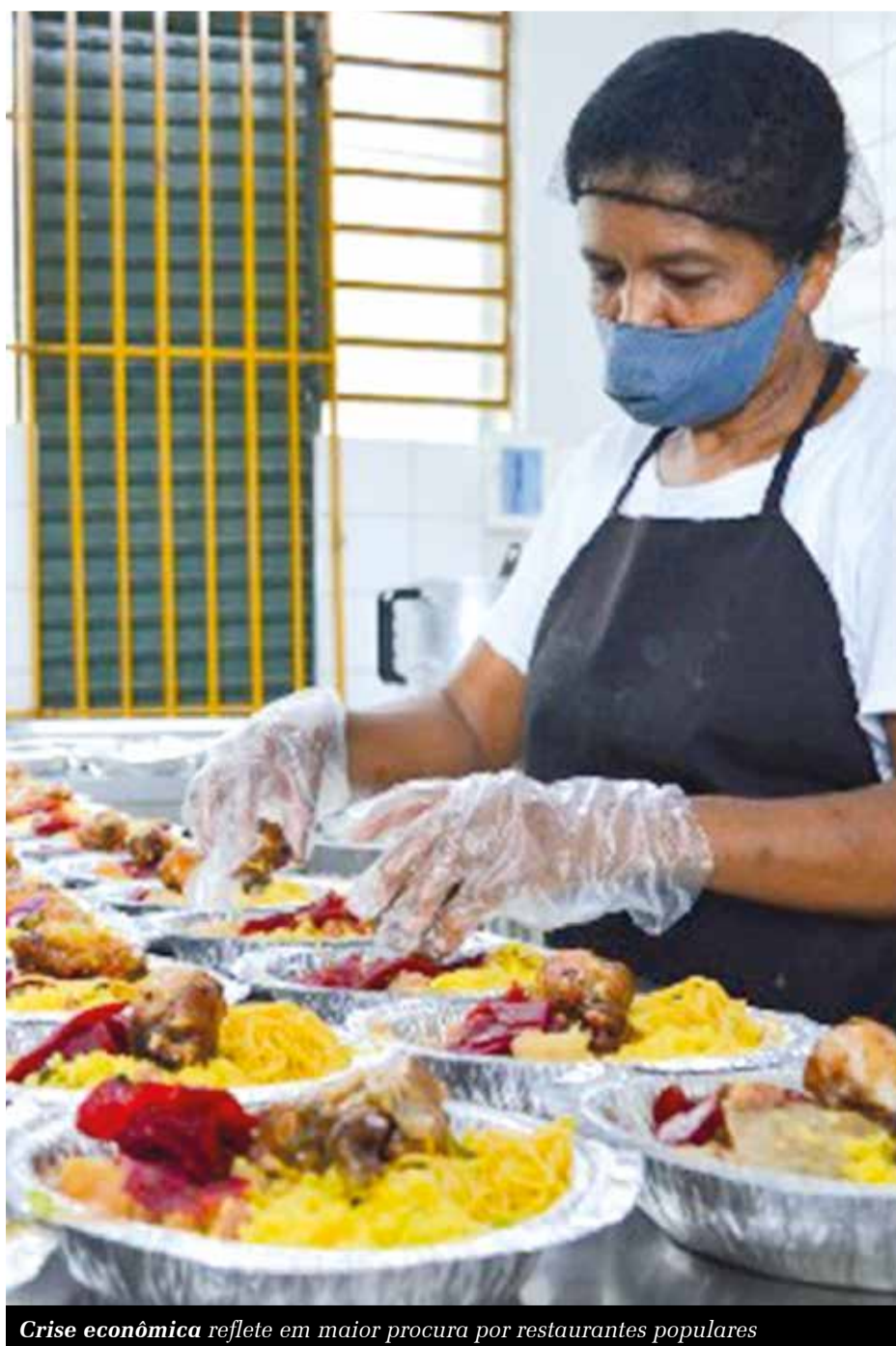
Crise econômica reflete em maior procura por restaurantes populares

Vereadores de oposição articulam a abertura de uma Comissão Parlamentar de Inquérito (CPI) para investigar as licitações realizadas pela Prefeitura de Juazeiro do Norte. O alvo da vez é o contrato para a coleta seletiva de lixo no Município. Sete assinaturas são necessárias para a abertura.