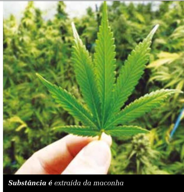
Substância é extraída da maconha