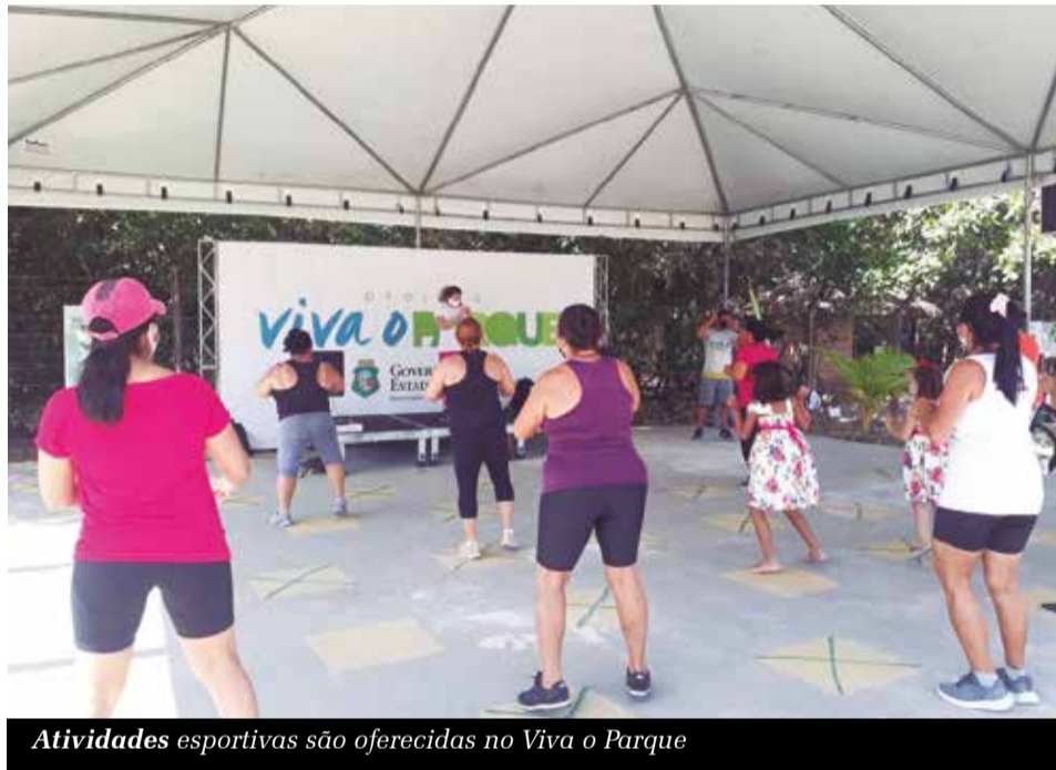
Atividades esportivas são oferecidas no Viva o Parque

Crato será o primeiro município do interior do Ceará a receber o Projeto Viva o Parque, que objetiva reaproximar população e natureza, através de atividades esportivas e educação ambiental, realizadas em unidades de conservação estaduais. As atividades são gratuitas e acontecerão em 50 domingos, de 8h às 12h.