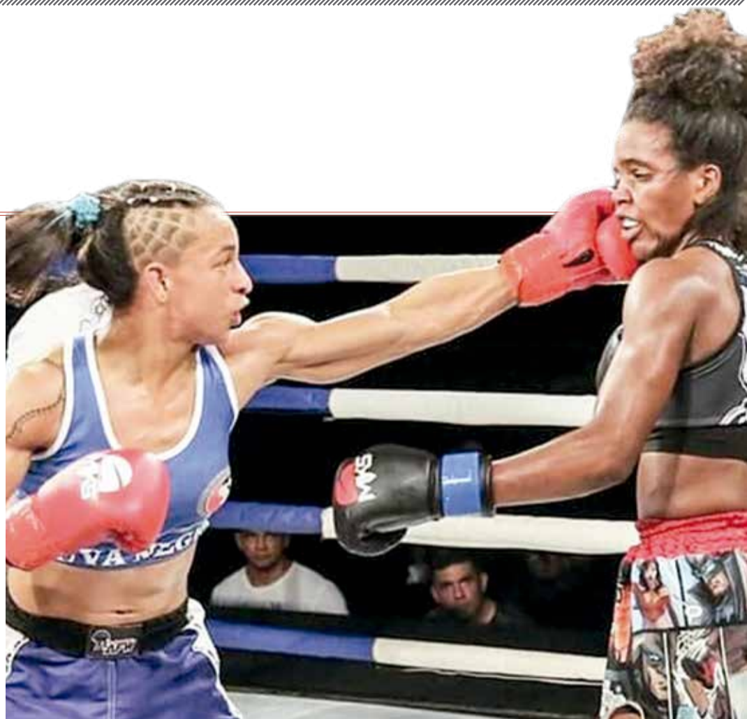
DE AZUL, Viúva Negra vive expectativa de assinar com um dos maiores eventos de luta do mundo

Kung fu. “Inicialmente, foi como uma defesa pessoal, mas com o tempo, comeci a competir, onde ganhei bastantes títulos. Vi que precisava ver novos horizontes, onde conheci a equipe Dragoncombat, grupo profissional que tem mix de artes marciais e tive oportunidade de ser campeã de Muay Thai, Kickboxing, Nogi (Jiu Jitsu sem kimono). A partir daí, fomos buscar o MMA, onde foi mais um grande salto na minha carreira”, relembra a lutadora, que coleciona uma série de títulos estaduais, como multicampeã em Sanda, Campeã no Kickboxing, o maior evento da América Latina, campeã