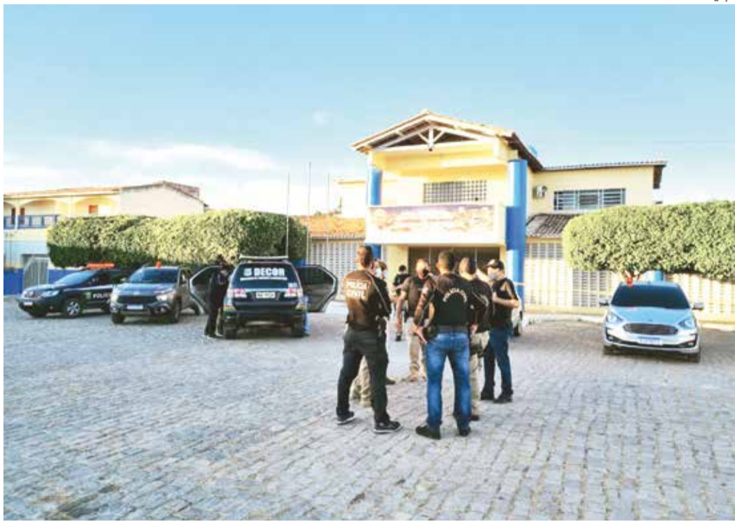
FORAM cumpridos sete mandados de busca e apreensão em Campos Sales e Salitre