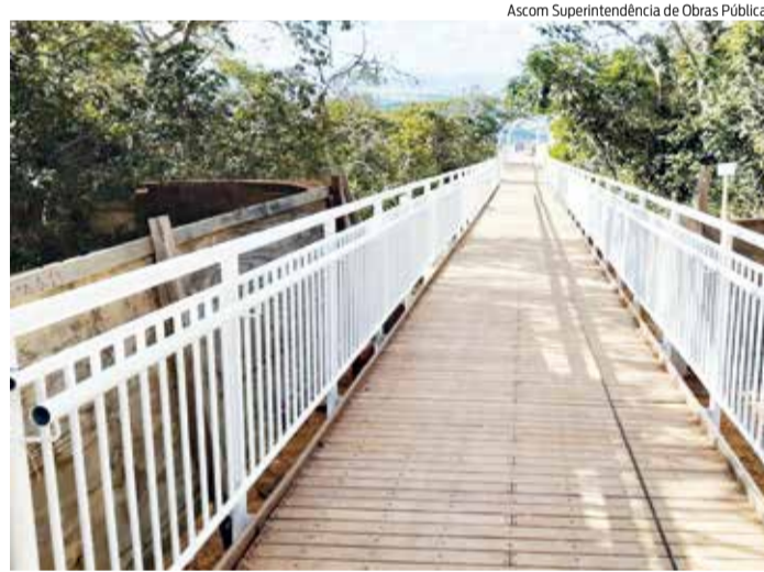
Ascom Superintendência de Obras Públicas

EQUIPAMENTO contará com teleférico, borboletário e galeria/museu