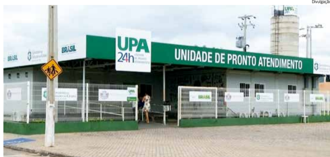
GESTÃO da UPA do Limoeiro e do Hospital São Lucas pelo Idab recebe críticas de juazeirenses