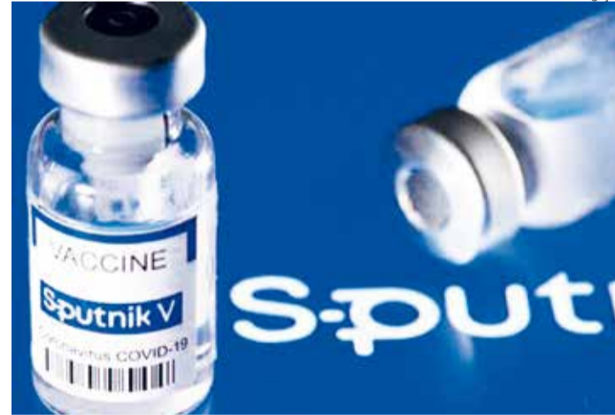
PREVISÃO é que imunizantes cheguem ao Ceará no início de julho