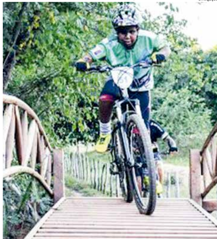
CERCA de 80 ciclistas participarão da competição

Uma área de três quilômetros e meio de extensão, no Sítio Poças, no município de Altaneira, é o cenário escolhido por quem vai se aventurar sobre duas rodas na Copa Mountain Bike Altaneira. Realizado na mesma área desde 2014, o campeonato é conhecido internacionalmente por ser uma derivação do ciclismo praticado em trilhas de terra ou estradas montanhosas. Em 2021, participam da competição 80 ciclistas distribuídos nas categorias adulto, juvenil e, pela primeira vez, 10 crianças disputando a Camisa Azul, que representa o campeão altaneirense. A Copa é disputada em seis etapas, sempre no final de cada mês do primeiro semestre.