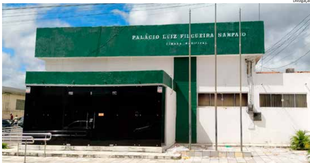
CRESCIMENTO da pandemia em 2021 foi pouco discutido nas Câmaras

No Crato, as principais discussões foram em torno de nomes de equipamentos públicos como a Areninha do Bairro Muriti e iluminação