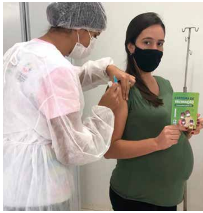
Prefeitura de Porteiras

A região avança na imunização em um cenário de descontrolado da covid-19. Até o fechamento desta edição, na noite de segunda-feira (10), 92 pessoas aguardavam por leitos na macrorregião de Saúde do Cariri: 40 por enfermarias e 52 por Unidades de Terapia Intensiva (UTI). Em demanda por leitos, o Cariri fica atrás apenas de Fortaleza. A taxa de ocupação registra 87% dos leitos de UTI com pacientes, dos quais 97% das UTI adulto estão ocupadas, além de 75% das enfermarias com pessoas em tratamento. Maior município