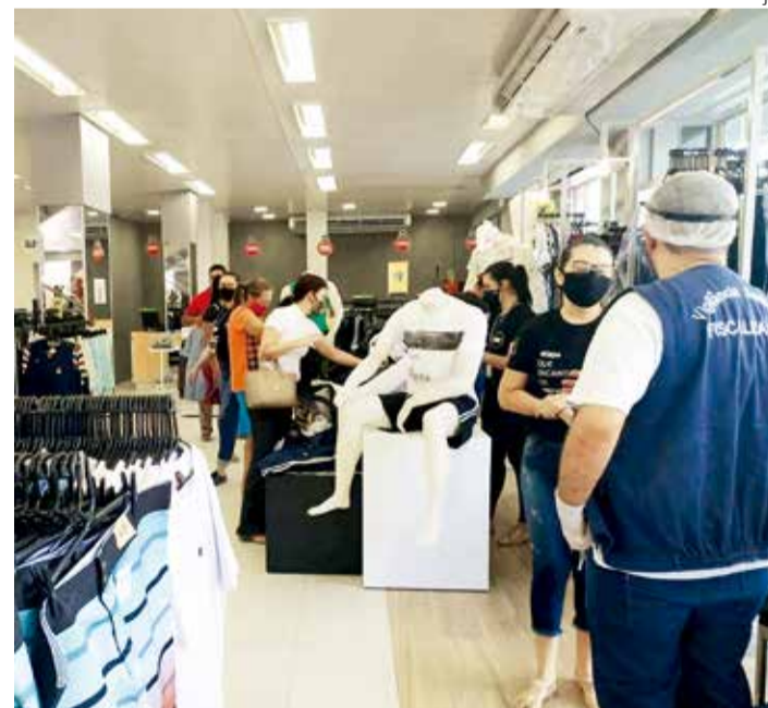
ÓRGÃO recomenda adoção de medidas para evitar propagação do vírus

O anúncio, feito em uma live, contou com as presenças e declaração de apoio