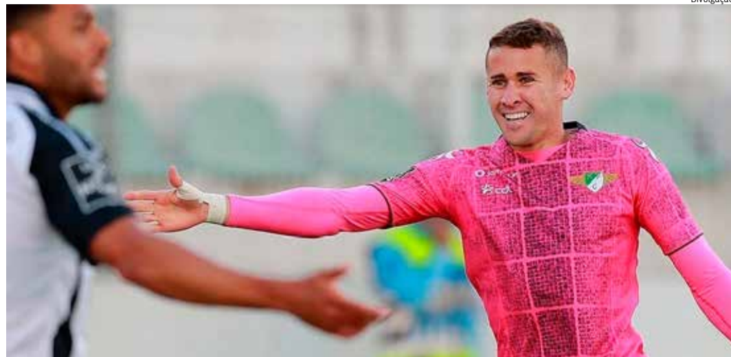
GALEGO, de 24 anos, atua no futebol português

De férias no Cariri, Galego lembrou as origens