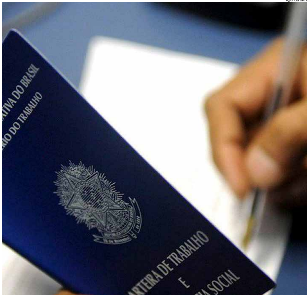
JUAZEIRO é a cidade com mais demissões no Cariri, com quase 4.500 desligamentos

Como isso, o Auxílio Emergencial, benefício fi-