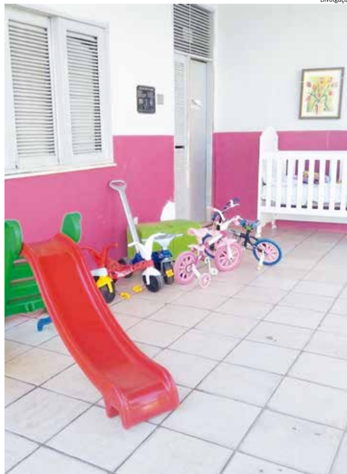
ADOÇÃO de crianças é desafio durante a pandemia

Muitas das crianças, por não se encaixarem no perfil priorizado, prosseguem residindo na casa abrigo, sem uma família. "Ademais, verdadeiramente, havia uma morosidade no sistema judiciário no processo de cadastramento, mas acreditamos que atualmente o processo de cadastro à adoção está prosseguindo de forma mais célere, desde a abertura da Vara Única da Infância e Juventude na comarca de Juazeiro do Norte, pois há um compromisso e empenho dedicados exclusivamente