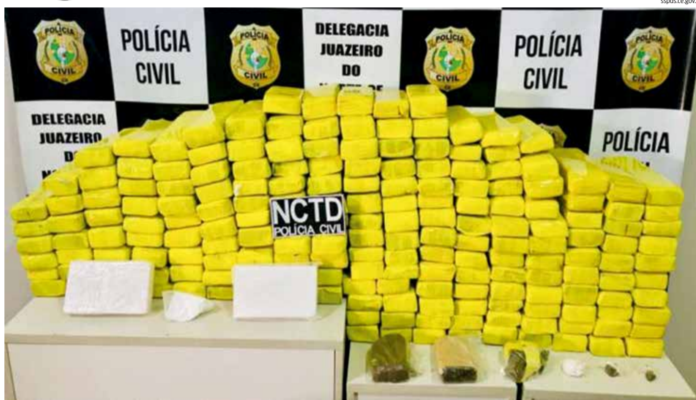
MAIS de 160 kg de entorpecentes foram apreendidos em Crato na segunda-feira (31)

O trânsito das drogas de outros estados para o Cariri tem em comum as apreensões nas rodoviárias