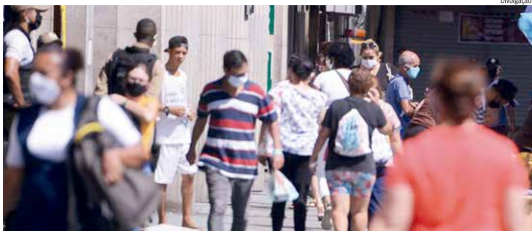
MOVIMENTAÇÃO nas ruas segue alta enquanto ocupação de leitos é superior a 93%

Na região do Cariri, somente os municípios de Barro, Lavras da Mangabeira e Granjeiro não figuram na