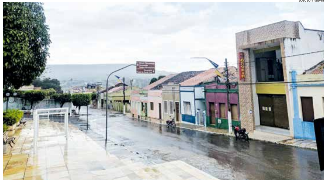
MEDIDAS foram tomadas diante do agravamento dos casos de covid-19