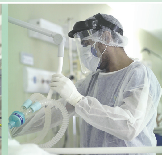
HOSPITAL REGIONAL NORTE SOBRAL