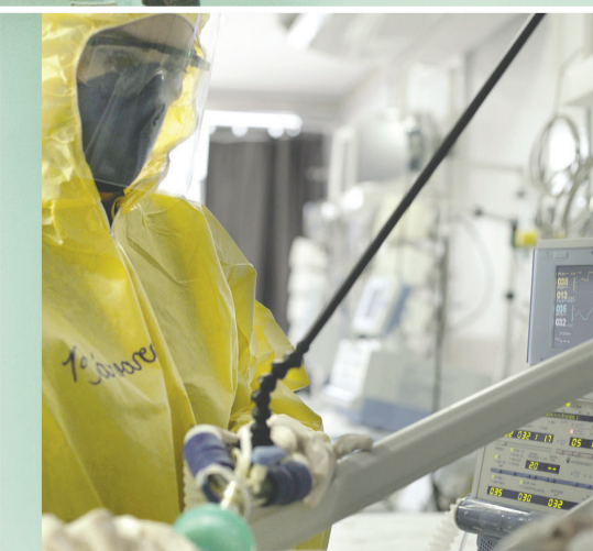
HOSPITAL GERAL DE CRATEÚS

GOVERNO DO ESTADO DO CEARÁ Secretaria da Saúde