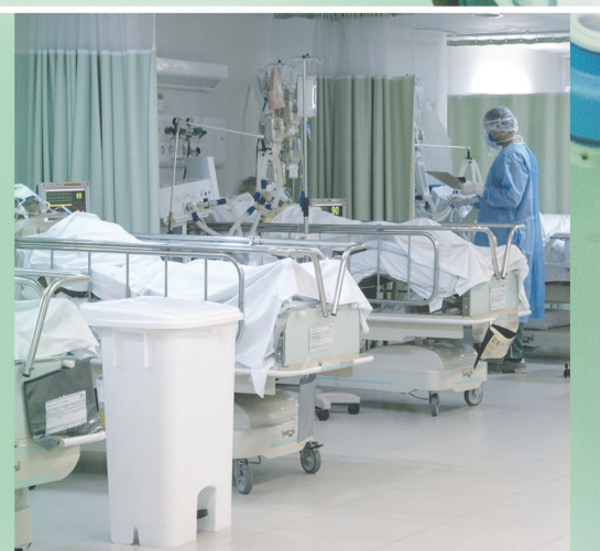
HOSPITAL REGIONAL DO SERTÃO CENTRAL QUIXERAMOBIM