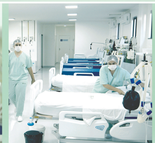
HOSPITAL SÃO VICENTE IGUATU