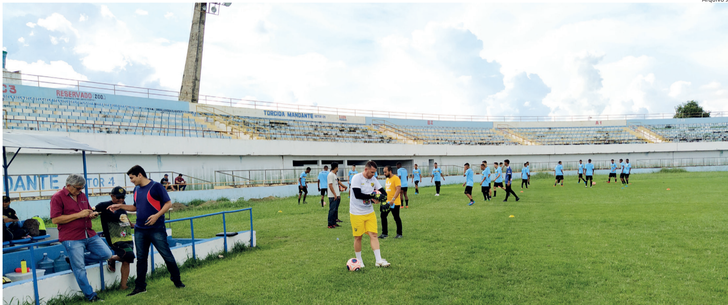
TIMES negociam redução de salários com jogadores