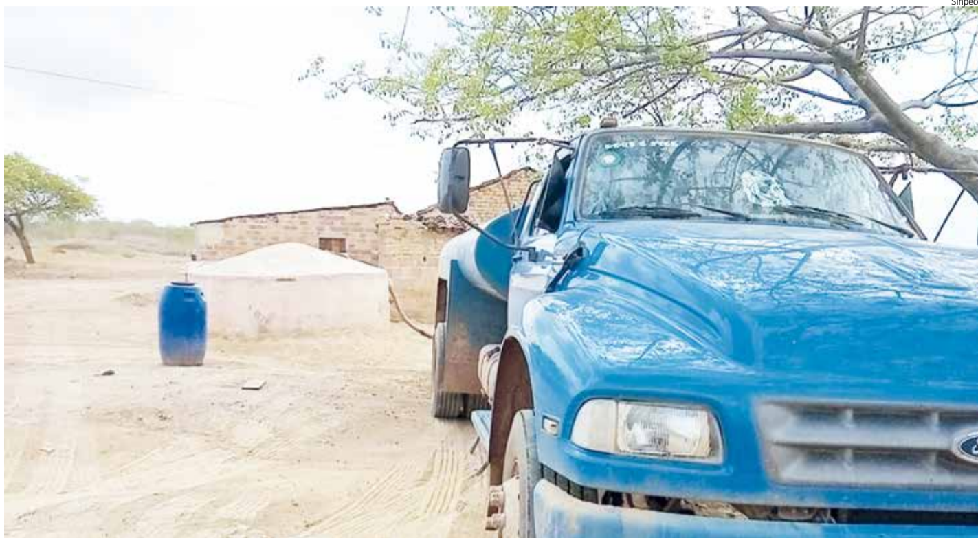
OPERAÇÃO contribui com abastecimento de água potável em comunidades urbanas e rurais