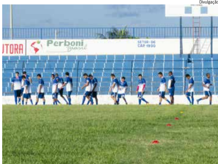
BARBALHA volta para a Série B após três participações na elite

O retorno do Barbalha à segunda divisão estadual era imaginado diante de problemas fora do campo. O time enfrentava dificuldades financeiras, a ponto de a direção ir à público afirmar que não teria como pagar os salários dos jogadores. Com