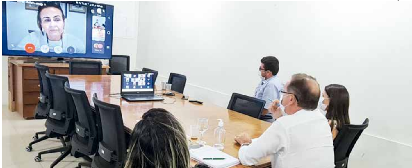
REUNIÃO entre prefeitos nesta segunda-feira (18) decidiu por novo lockdown em Crato, Juazeiro e Barbalha

Atualmente, ao menos sete casos da variante brasileira P1 do novo coronavírus, inicialmente encontrada no estado do Amazonas, foram identificados em três municípios do Cariri: quatro em Brejo Santo, dois em Juazeiro do Norte e um em Crato. Outros pacientes com sus-