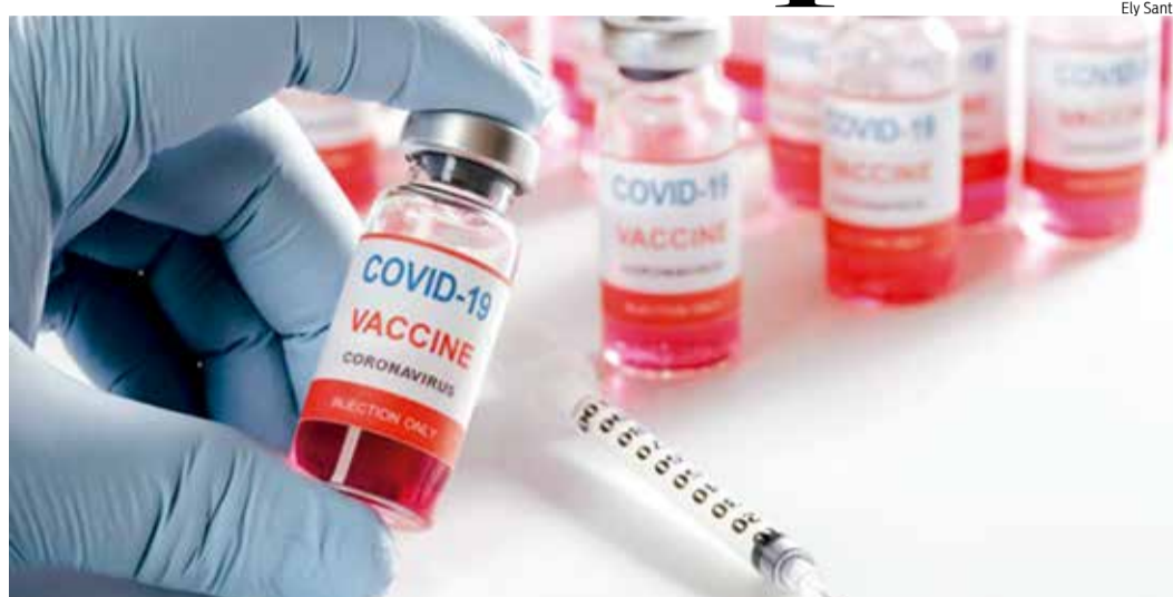
MAIS um lote de vacina deve ser destinado ao Cariri no início da próxima semana

Em nota enviada ao Jornal do Cariri, o MPCE informa ter recebido 75 denúncias de desrespeito às prioridades de vacinação - que atualmente são profissionais de saúde e idosos. Os registros ocorreram em 29 cidades cearenses, das quais estão Barbalha, Crato, Juazeiro do Norte, Missão Velha e Vár-