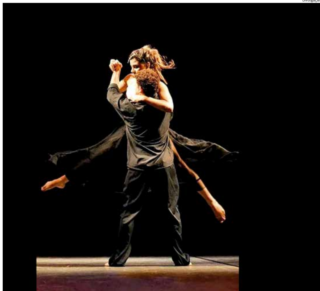
COMPANHIA retoma atividades depois de paralisação por conta da pandemia