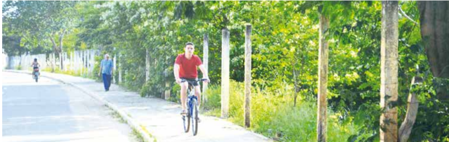
GRUPO de ambientalistas é encabeçado por ex-vereador

Além de pautar demandas específicas, os ativistas observaram a necessidade de nova reunião para tratar exclusivamente da proteção dos animais domésticos de Juazeiro do Norte. O documento será encaminhado aos órgãos municipais competentes como AMAJU e SEMASP. “Ficou explícito o sentimento de resolução dos problemas apontados e a real possibilidade de parcerias com o Governo Municipal de Juazeiro do Norte”, afirmou o manifesto em nota.. ▶