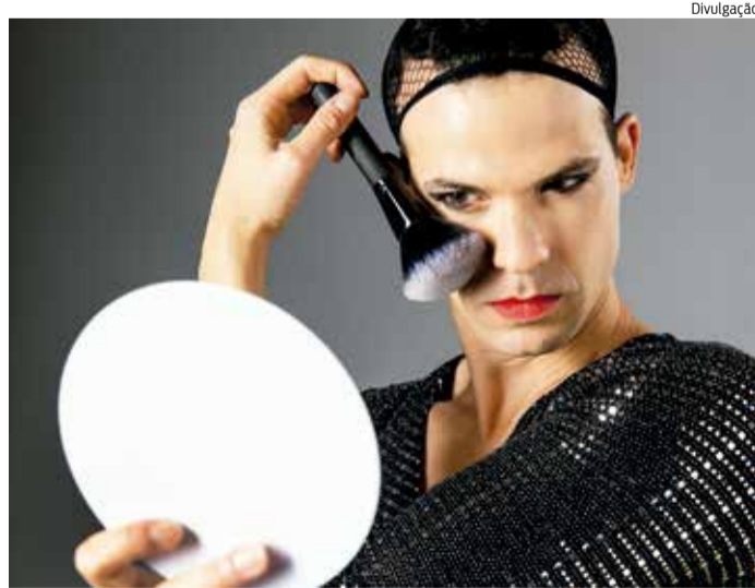
DIA da visibilidade trans será celebrado esta semana