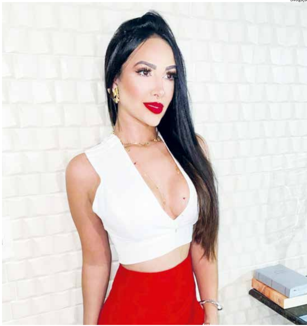
DIGITAL influencer morreu no último domingo, por complicações clínicas após lipoaspiração