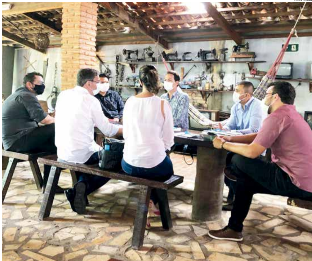
GRUPO de secretários quer o fortalecimento da rota turística do Cariri

Durante a pandemia, alguns pontos de visitação tiveram que ser fechados