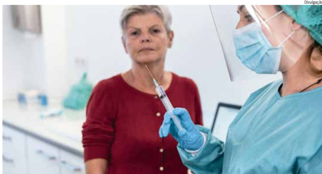
IDOSOS com mais de 75 anos começarão a ser vacinados

Desde o final de semana, mais de 105 mil novas doses chegaram ao Ceará. Ao todo, o Estado já recebeu três lotes de imunizantes. As primeiras 218 mil doses, da CoronaVac,