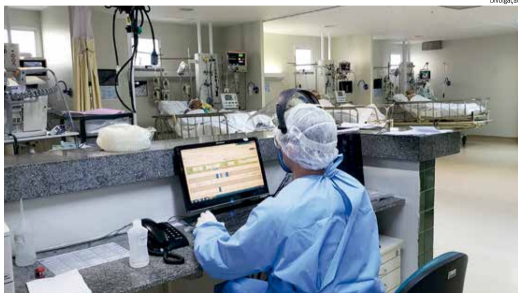
TODOS os 31 leitos do Hospital Regional do Cariri estão ocupados