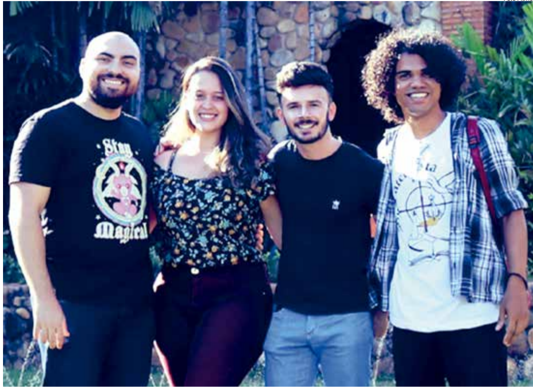
PRODUTORA está na fase de captação de recursos

A produção está prevista para começar a ser filmada entre maio e junho deste ano. O elenco é distribuído entre artistas globais como Marcos Wainberg, que dará vida ao Barão de Aquiraz; Miguel