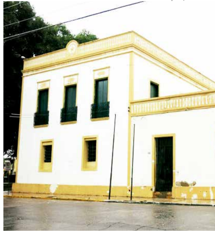
LOCALIZADO no centro do Crato, equipamento já foi cadeia pública

Fechado há cerca de 14 anos, o museu de arte recebeu o nome do primeiro pintor cratense a conduzir a cidade para o mundo das artes, de acordo com o depoimento da artista plásti-