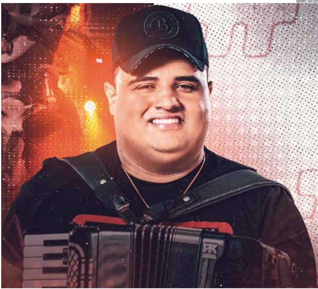
O CANTOR é natural do município de Campos Sales