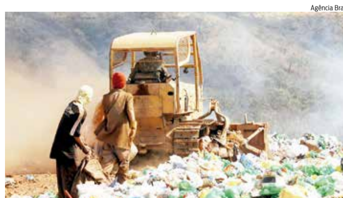
ATERRO será mantido em consórcio de municípios

A iniciativa teve início ainda em 2008, quando o Governo do Ceará anunciou a construção de 12 aterros sanitários por meio de gestão consorciada no Estado. Este modelo de consórcio permanecerá na proposta atual: o governo estadual custeará a construção e os municípios se responsabilizarão, juntos, pela manutenção mensal do equipamento. No projeto de 2008, o aterro do Cariri teria sede em Crato. Novas reuniões serão realizadas para discutir e planejar a construção junto aos nove prefeitos da Região Metropolitana do Cariri. Segundo o deputado estadual caririense Fernando Santana (PT),