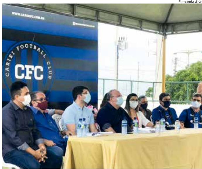
NOVA equipe estreia na Série C do Cearense