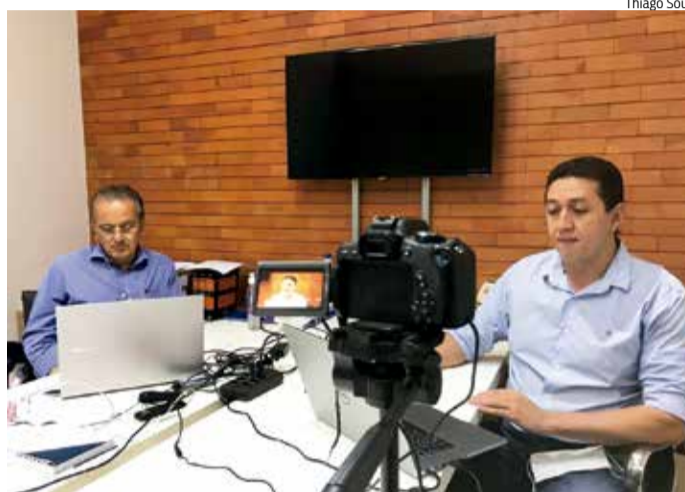
CONTRATOS na Saúde e Limpeza Urbana são alvos da auditoria

sofrido um aumento de 100%. O caso está sendo investigado pelo Ministério Público do Estado.