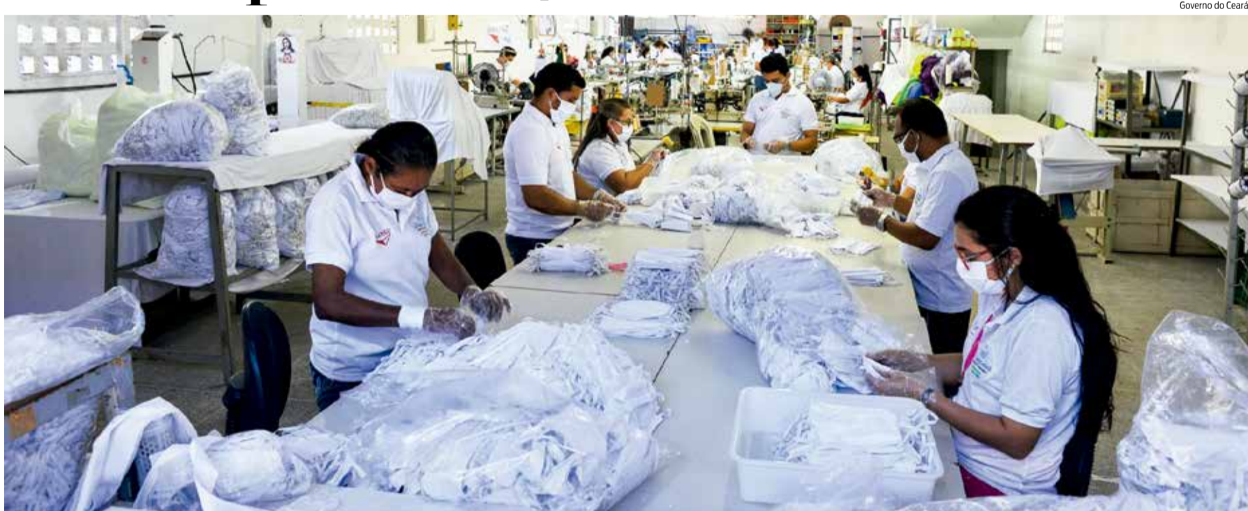
Governo do Ceará