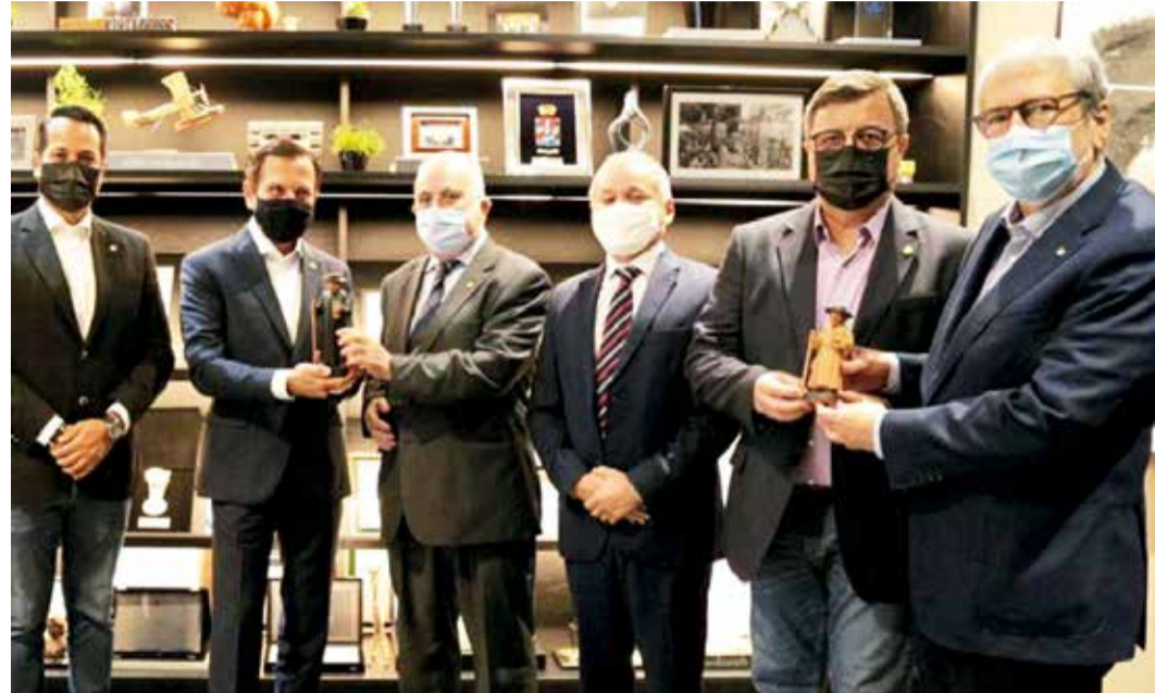
REUNIÃO entre lideranças do Ceará e o governador João Dória, de São Paulo, garantiu doses da vacina para Juazeiro

No Craxubar, apenas Juazeiro do Norte está incluído na categoria de "altíssimo" risco, ou nível 4. Crato apa-