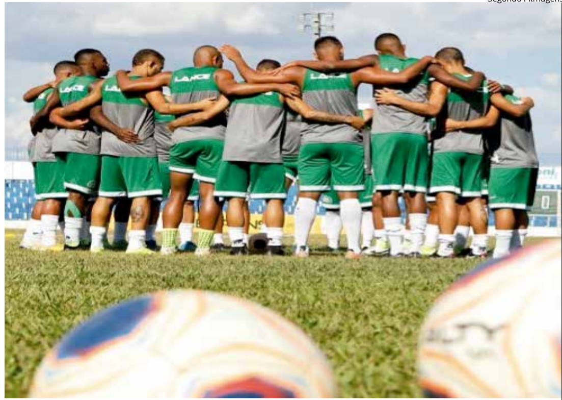
VERDÃO do Cariri quer voltar a disputar competições nacionais