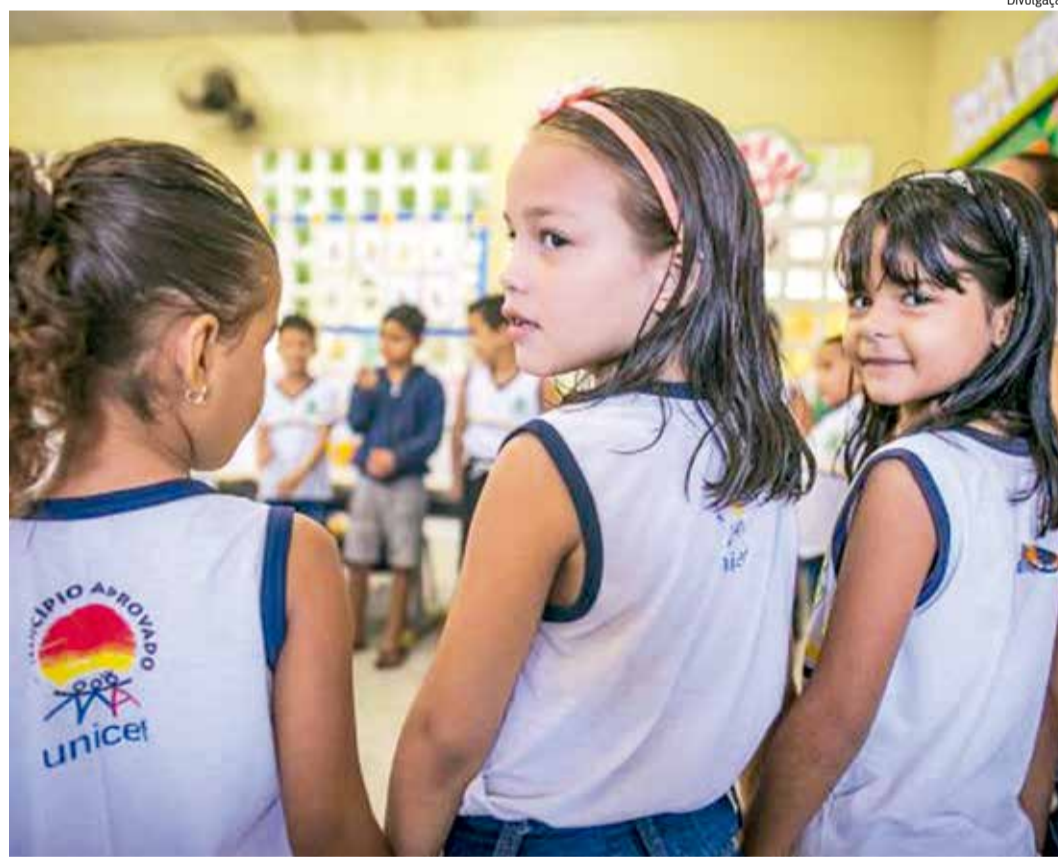
O SELO Unicef é uma iniciativa que visa garantir os direitos das crianças e adolescentes

Esta edição teve início em 2017, quando os gestores municipais assinaram um termo assumindo o compromisso para trabalhar, durante os quatro anos de mandato, pela garantia dos direitos de jovens em situação de vulnerabilidade e também assegurar que o Conselho Municipal da Criança e do Adolescente (CMDCA) esteja funcionando em boas condições. Após a adesão, eles definiram um articulador e um mobilizador de jovens para desenvolver políticas públicas nas áreas da Educação, Saúde, Cultura e Assistência Social e participarem de capacitações e cursos, presenciais e à distância, ofertados pelo equipe do Unicef e parceiros a fim de auxiliar os par-