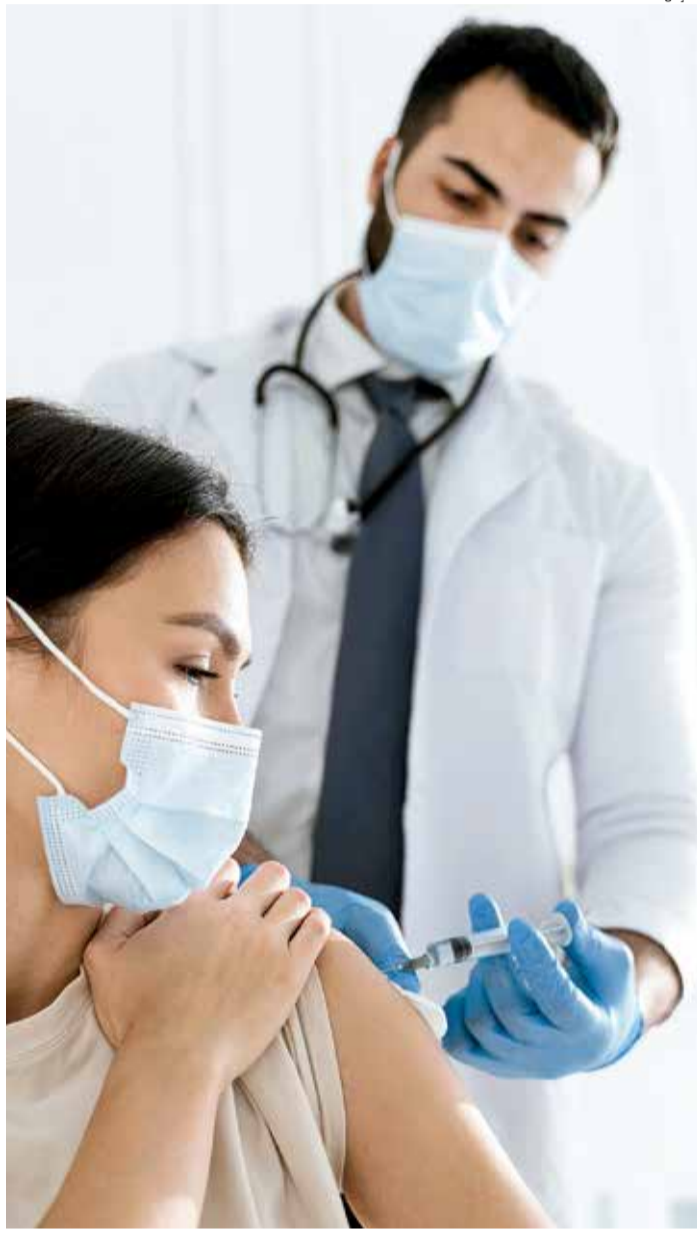
IMUNIZAÇÃO ainda não possui data definitiva para acontecer na região

Apesar de ainda não ter data definida, o Ministério da Saúde pretende que, até o mês de março, comece a distribuição da vacina de Oxford e do Laboratório AstraZeneca, que será produzida no Brasil pela FioCruz.