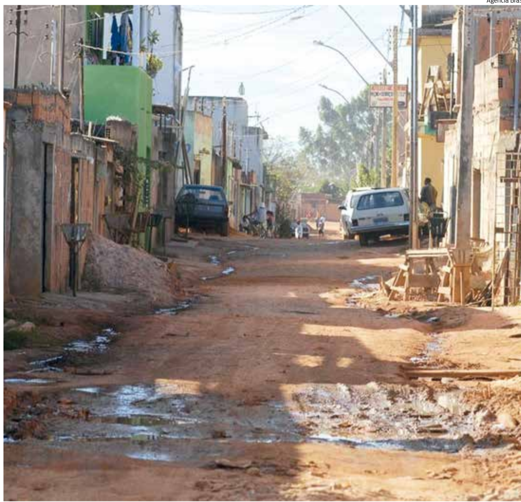
EM 2019, cerca de 47% dos cearenses viviam com até meio salário mínimo