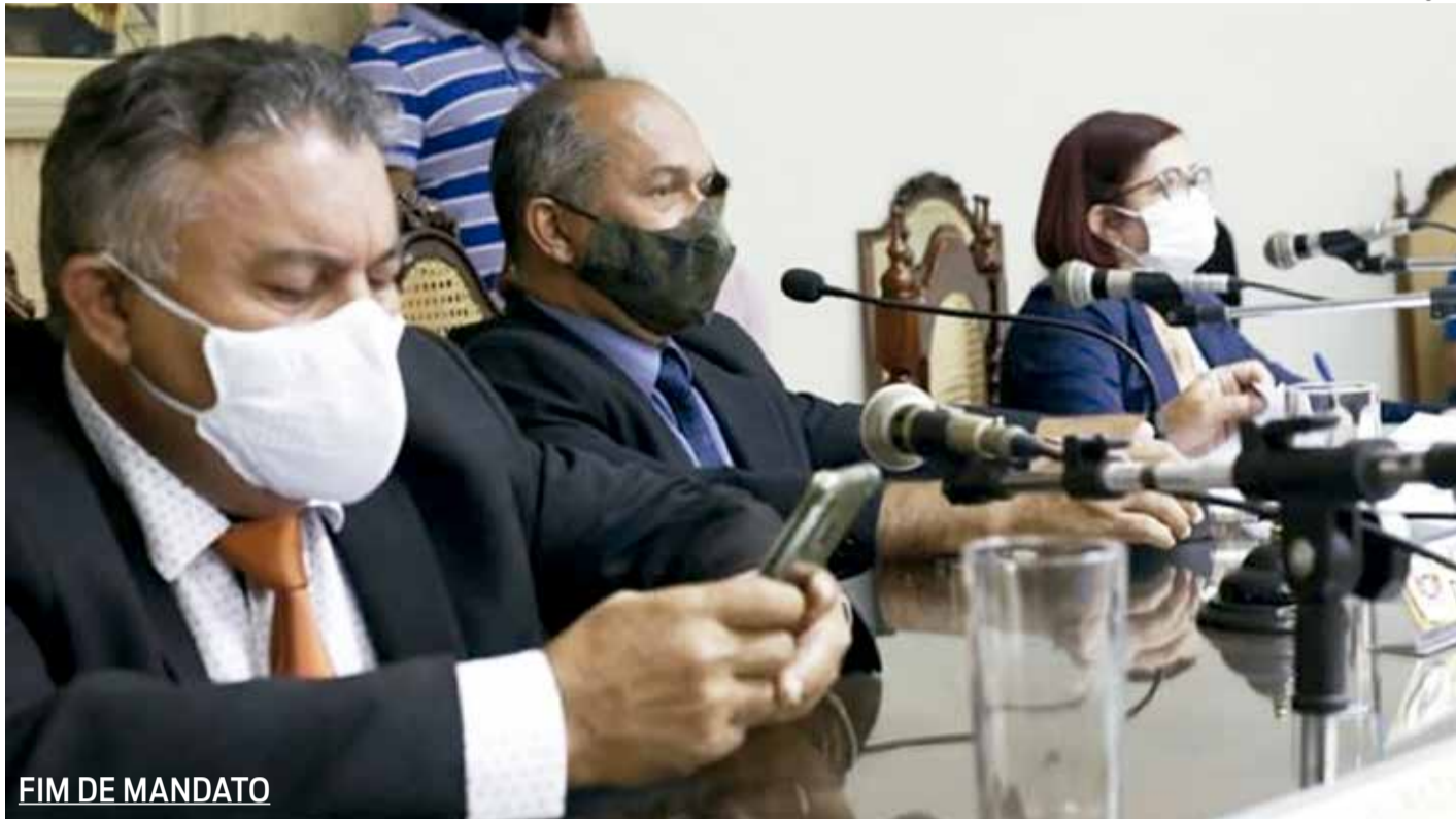
FIM DE MANDATO

▶ Desculpe a ignorância , os FGs vão insistir em barrar a candidatura do governador Camilo Santana ao Senado Federal?