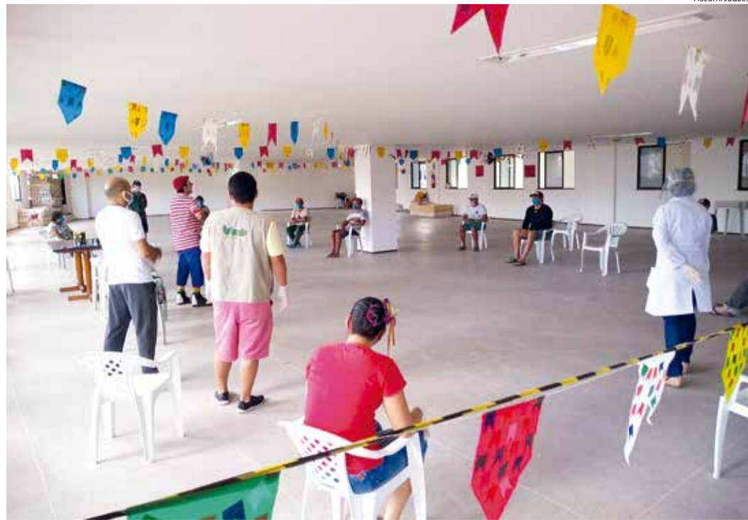
EQUIPE do Caps Ad, de Juazeiro, realizou ações com pessoas em situação de rua durante isolamento social