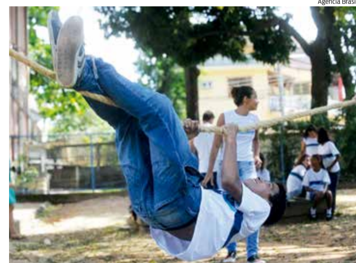
PROTEÇÃO à infância é um dos objetivos do projeto

Pesquisa do Unicef realizada em julho de 2020, junto a 1.516 pessoas, aponta que famílias com crianças ou adolescentes foram as mais impactadas pela crise provocada pela covid-19 no Brasil. Nesse sentido, o foco será o Desenvolvimento Infantil, a Proteção da infância, os Projetos dos adolescentes e a garantia do direito à Saúde Mental e Busca Ativa Escolar, que promove o acesso seguro à escola. Os gestores deverão realizar atividades como a “Semana do Bebê Dentro de Casa”, para apre-