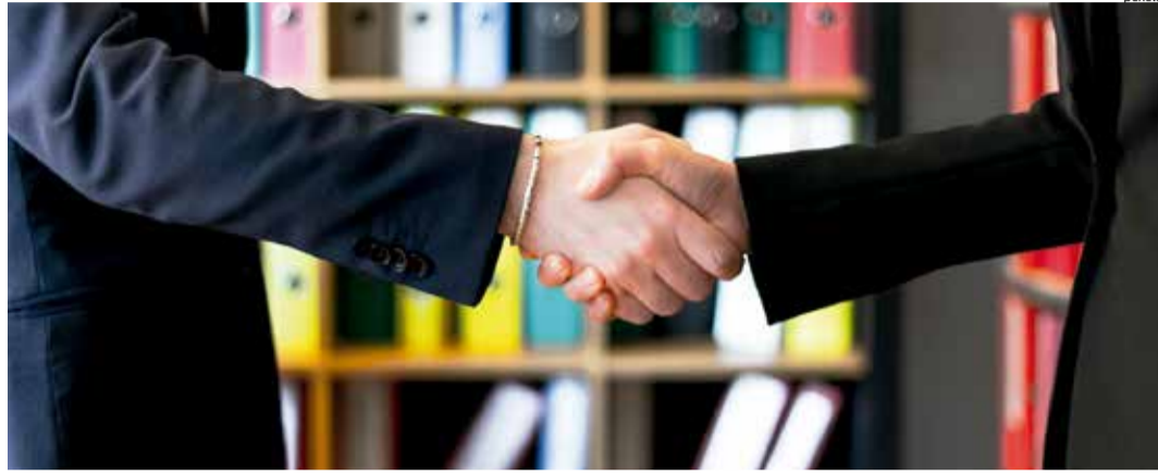
ÓRGÃOS de fiscalização orientam criação de equipes para transição de mandatos

Ações como essa são comuns no Ceará, especialmente quando a mudança de um mandato para outro envolve