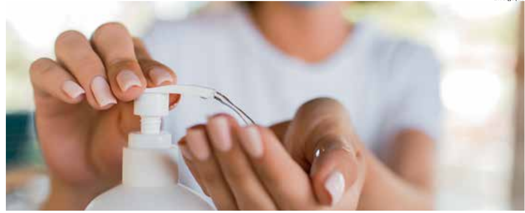
JUAZEIRO registra aumento de 704% nos casos suspeitos de covid-19, entre setembro e novembro

No Crato, os casos suspeitos saltaram de 285 (27 de setembro) para 574 (15 de novembro): um aumento superior a 100%. O número de mortos saltou de 87 para 101, um aumento de 14 óbitos. Entre os infectados, outro