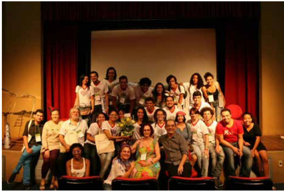
ARTISTAS , professores da rede pública e outros educadores podem se inscrever na programação do evento