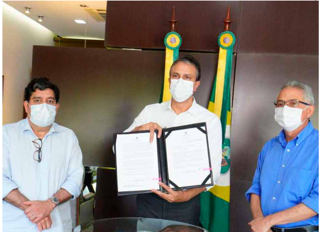
PROPOSTA foi apresentada na semana passada pelo governador Camilo Santana

O ICMS é uma das principais fontes de receita dos municípios caririenses. Parte do valor de um produto comprado ou de um serviço contratado na região é recolhida pelo Governo do Ceará por meio deste imposto. Conforme a Constituição Federal, os estados devem dividir 25% do total arrecadado com os municípios. No projeto enviado à Assembleia, o repasse para as prefeituras cearenses saltaria dos atuais R$ 175 milhões para R$ 525 milhões. Segundo o secretário de Finanças de Crato, Carlos