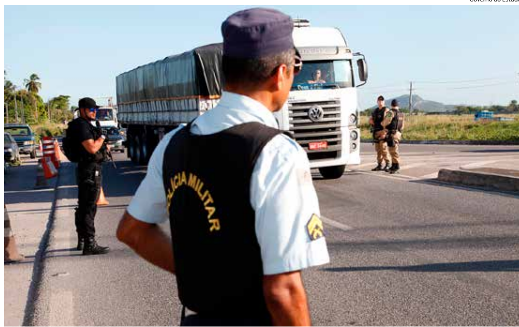
ROUBO de cargas está no rol dos crimes que oscilaram na pandemia

Os números são semelhantes aos CVPs 2, que incluem roubos à residência, cargas, veículos e com restrição da liberdade da vítima. Depois de 32 casos em março e outros 32 em abril, esse tipo de crime reduziu para 30 ocorrências em maio, 23 em junho, 21 em julho e voltou a crescer em agosto, com 32 registros. Quanto aos furtos, eles caíram de 274 em março para