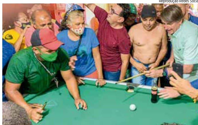
PRESIDENTE Bolsonaro joga sinuca em bar de Missão Velha