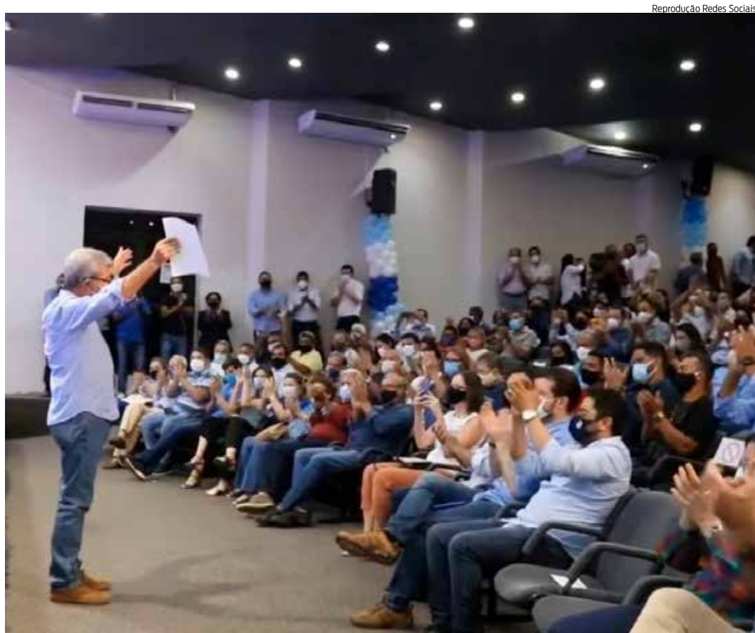
CONVENÇÃO do PTB foi realizada no dia 13 de setembro