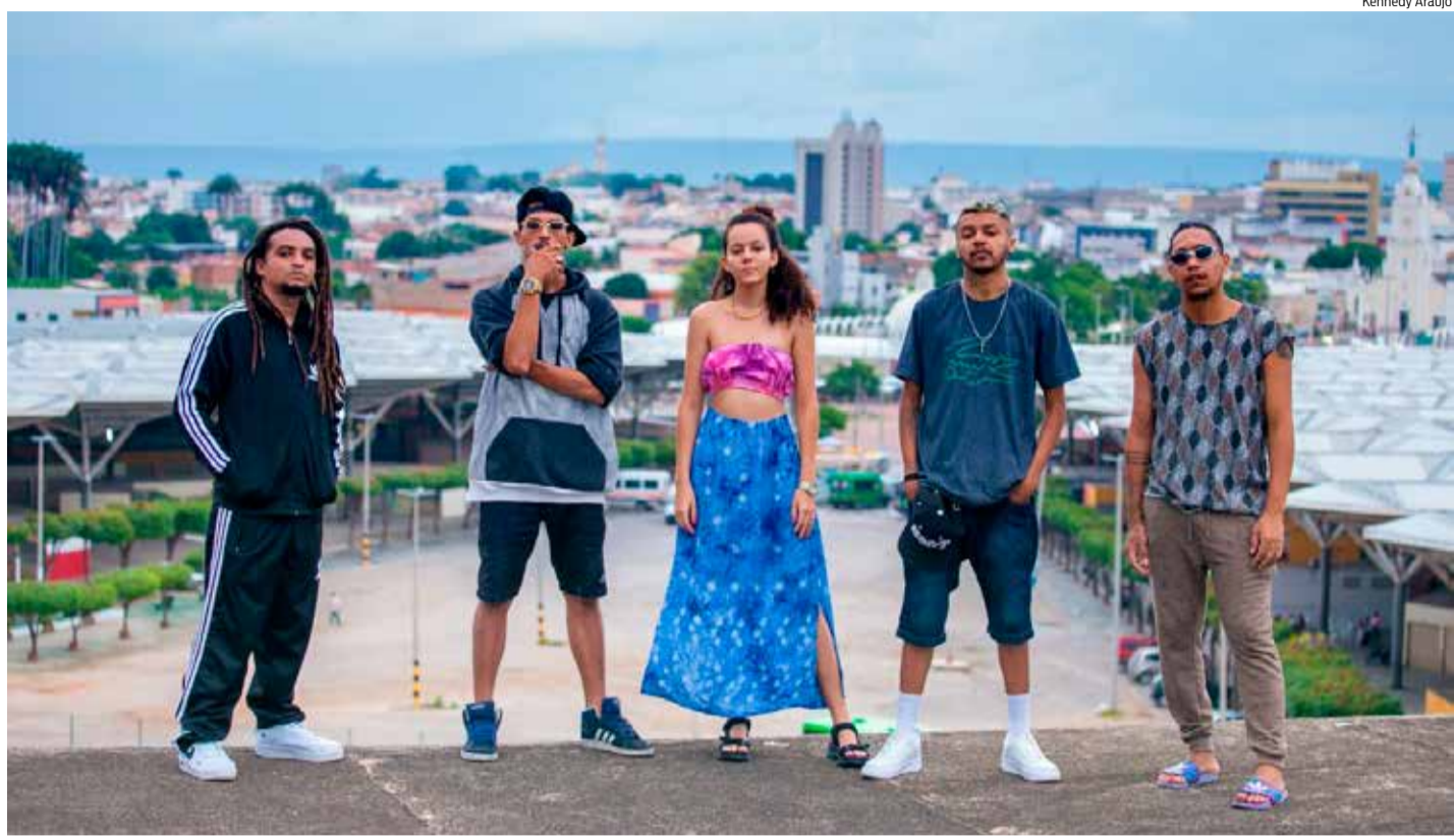
NOME Green Valleys foi escolhido em homenagem aos verdes vales caririenses