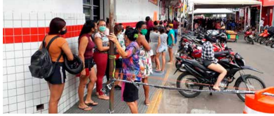
Guto Vital / Agência Miséria