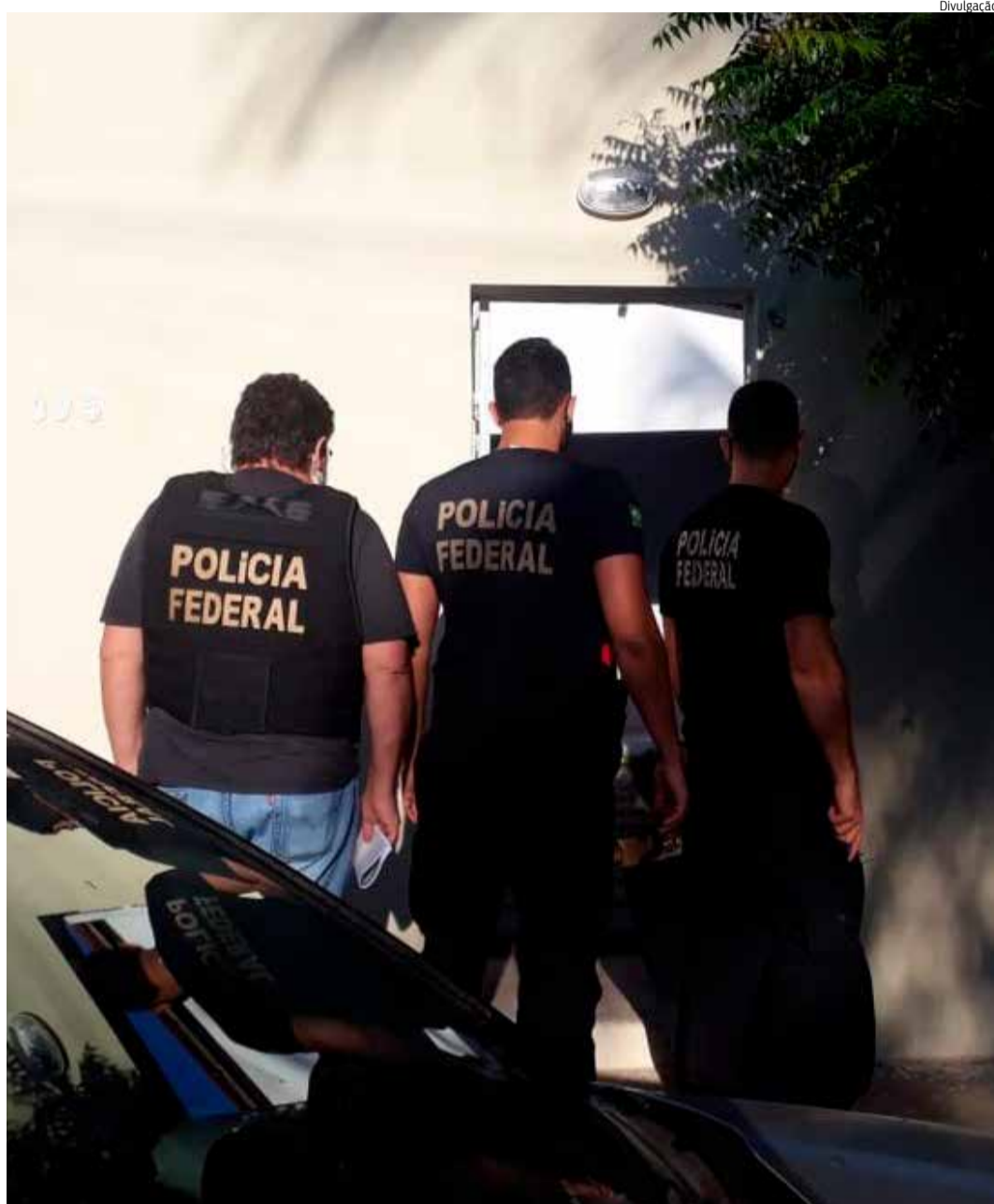
POLÍCIA FEDERAL colheu provas de supostas irregularidades na aquisição de livros

No dia 17, a operação Jasmim coletou provas para um inquérito que apura crimes de lavagem de dinheiro