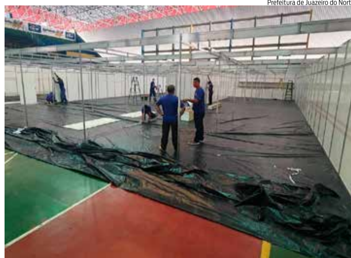
Prefeitura de Juazeiro do Norte

O montante voltado ao Cariri representa 9,21% do valor destinado ao Ceará, de R$ 229 milhões. A maior parte do valor deverá ser usada para a manutenção administrativo-financeira dos municípios, de livre destinação, enquanto outra fração deve ser obrigatoriamente usada nas áreas da Saúde e Assistência Social. As cidades que compõem o Triângulo Crajubar são