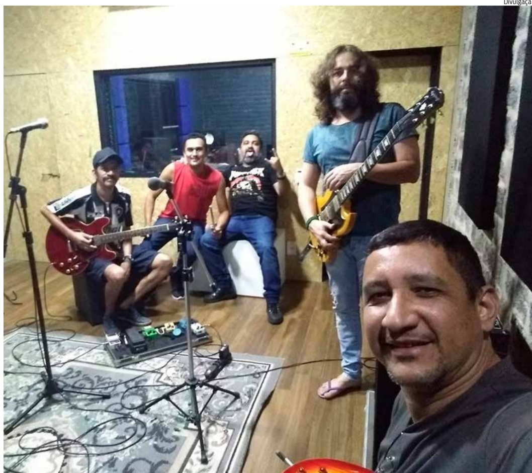
BANDA planeja gravação de álbum com músicas autorais

De acordo com os integrantes da Eutanásia, o nome foi escolhido após sugestão de Hermocélio, que pensou em algo agressivo e rápido de ser dito e