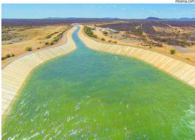
MUNICÍPIOS que margeiam canais e reservatórios serão diretamente beneficiados