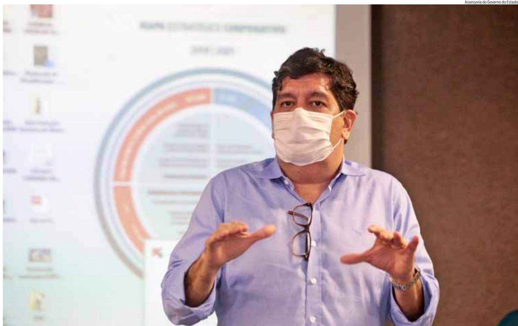
SECRETÁRIO de Saúde, Dr. Cabeto, visitou o Hospital Regional do Cariri nesta segunda-feira (29)

O crescimento de pessoas infectadas e óbitos ocasionados pela covid-19 levou o Governo do Ceará a direcionar as atenções para os municípios caririenses, com a adoção de duas medidas. A primeira delas é ampliação de municípios em isolamento social rígido, mantendo Juazeiro e acrescentando Barbalha, Crato e Brejo Santo. A segunda medida foi o envio, ao Cariri, do secretário estadual da Saúde, Dr. Cabeto. A vinda, segundo o próprio gestor, tem o intuito de organizar e planejar ações de enfrentamento ao novo coronavírus. Entre elas, estão o estabelecimento de metas e a ampliação