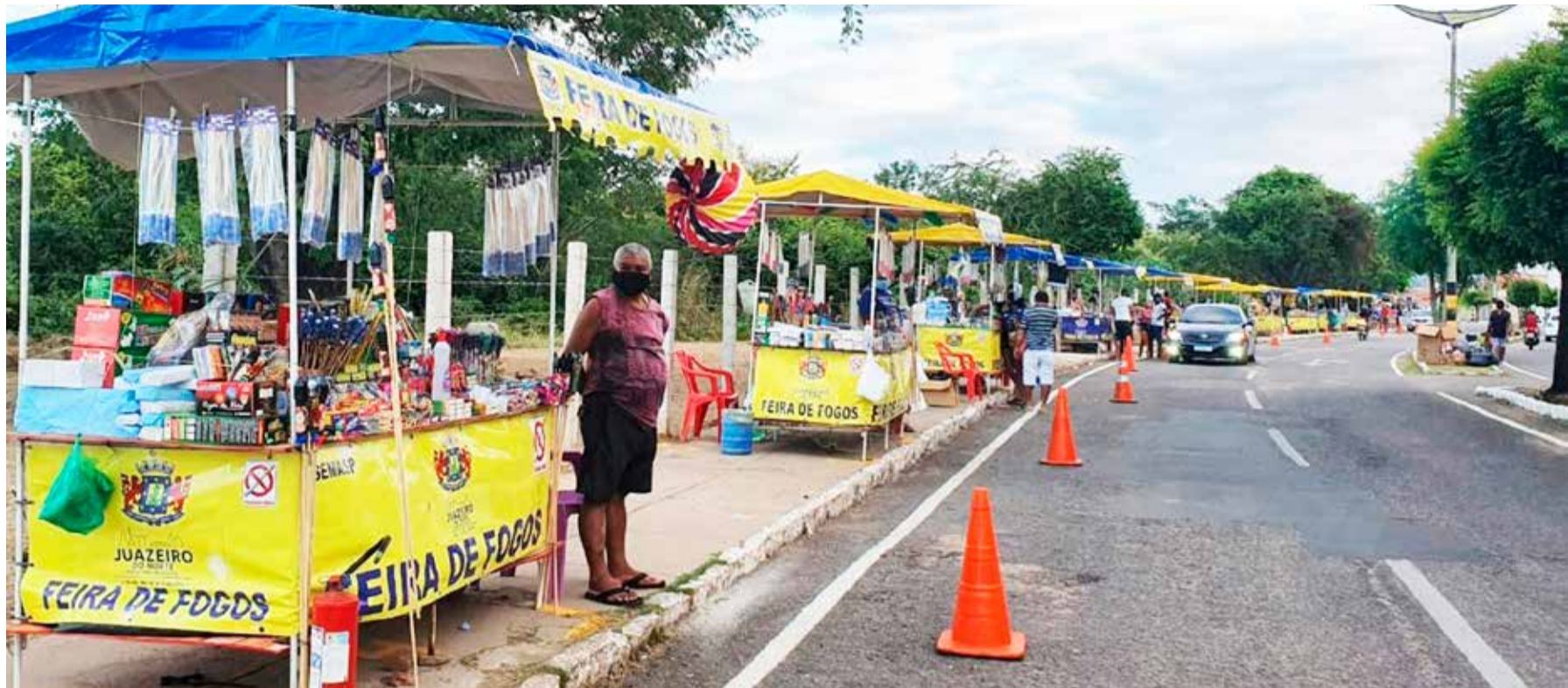
FEIRA de fogos, em Juazeiro, foi cancelada por força do novo decreto municipal de isolamento social rígido

Em Juazeiro do Norte, no decreto municipal de isolamento social rígido, que entrou em vigor nesta segunda-feira (22), a Prefeitura proibiu a venda e o uso de fogueiras e produtos explosivos, como fogos de artifício e bombas, enquanto o decreto estiver em vigor. A vigência é de