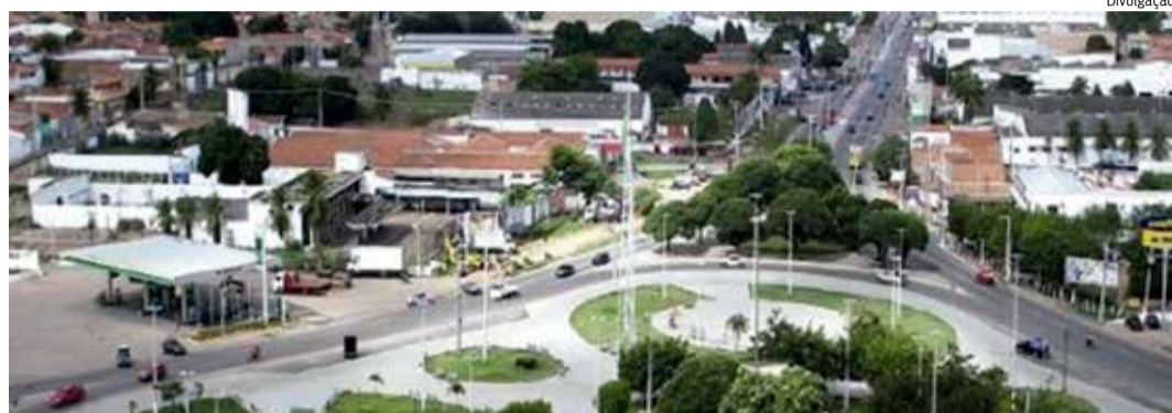
JUAZEIRO registrou aumento de 73% dos casos em uma semana